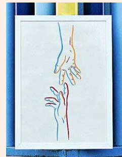
La última obra de Coco Dávez.

Es la última obra de Coco Dávez y está inspirada en la danza. Como si fueran las manos de Maya Plisetskaya, la bailarina rusa que interpretó como ninguna La muerte del cisne , responde a la fijación que Dávez tiene por las manos. "Me gusta la danza y las manos femeninas, creo que estas líneas simples representan la delicadeza y la elegancia", explica la artista.